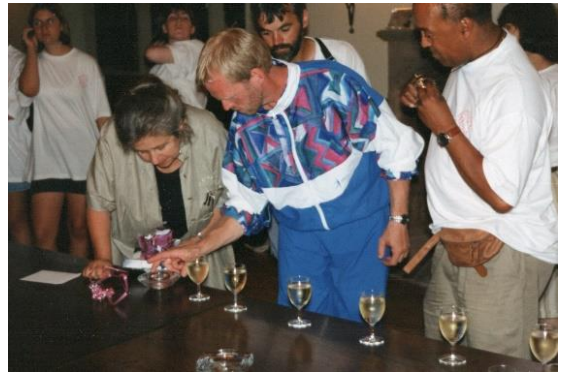
Vi er æresgæster på rådhuset i Echternach