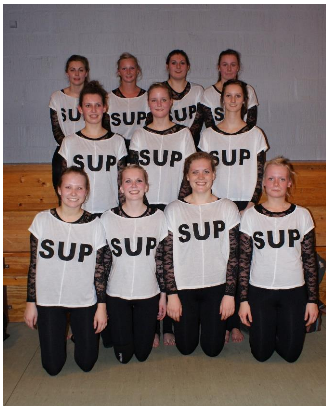
SUP – Selvstændige Unge Piger – til opvisning 18. marts 2012 i Rødning Centret