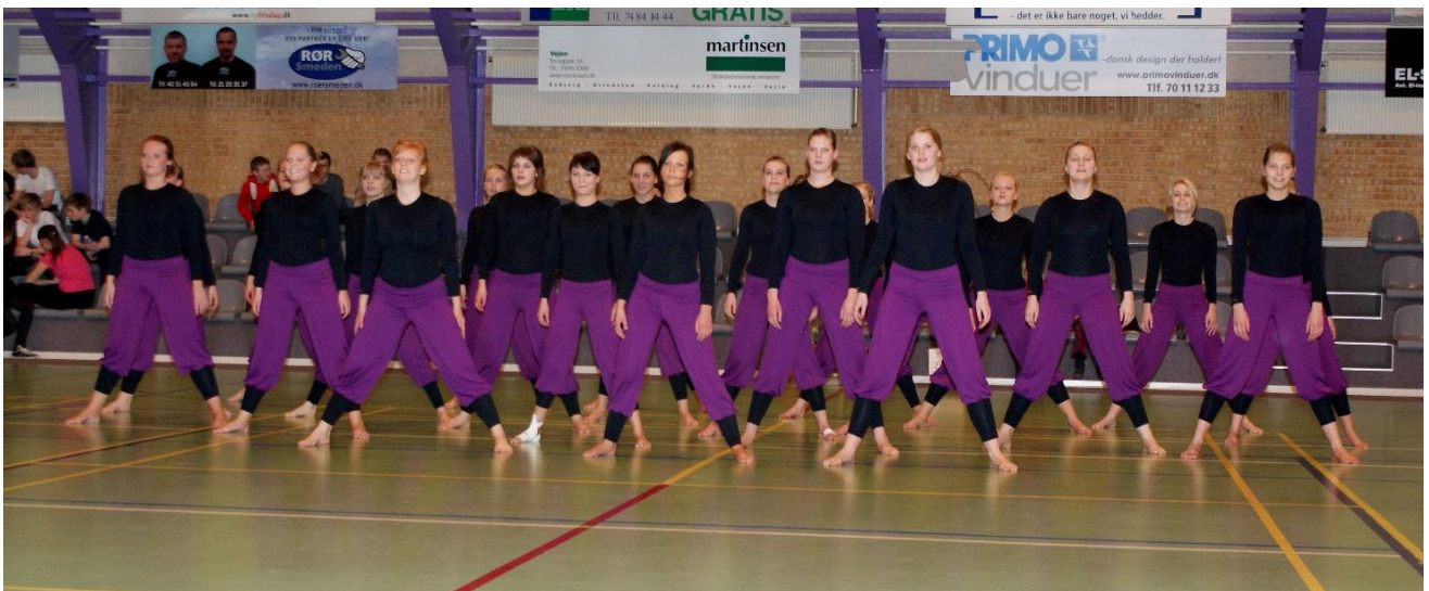
Nuvorøstø's opvisning 14. marts 2009

Nustrup Ungdomsforening Rødning Gymnastikforening Vojens Gymnastikforening Stenderup/ Øster Lindet Ungdomsforening