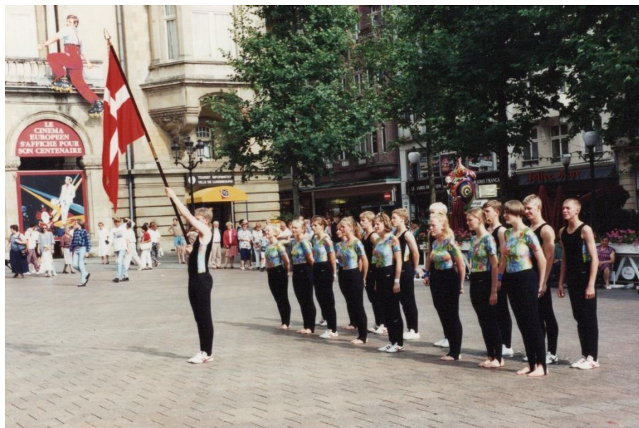
Opvisning i Luxembourg City