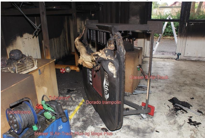
Fotos af brændte gymnastikredskaber

Der var leveringstid på nogle af tingene og selvom håndværkerne arbejdede så godt som dag og nat + weekend, var det hele ikke klar til sæsonstart i uge 37. Nogle af holdene måtte udsætte sæsonstart et par uger. Men alt blev godt igen på trods af denne voldsomme brand.