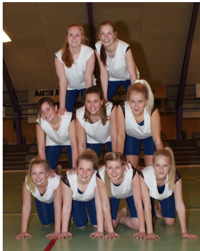
SUP til opvisning 20. marts 2013